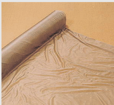
Aaronia-Shield® ist antiseptisch