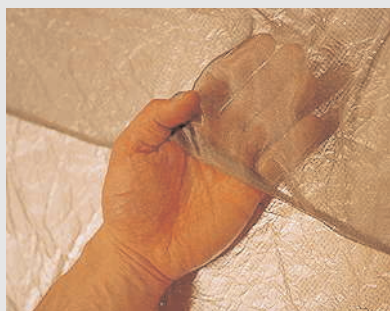
Aaronia-Shield® bietet höchste Transparenz und Luftdurchlässigkeit

Die verschiedenen derzeit auf dem Markt erhältlichen "transparenten" Abschirmsysteme unterscheiden sich in ihrer Schutzwirkung und Wirtschaftlichkeit erheblich und bieten besonders im hohen GHz-Bereich meist kaum noch Schutz. Meist sind die Systeme auch noch extrem teuer und bieten auch keinen Schutz vor niederfrequenten (NF) Strahlungen.