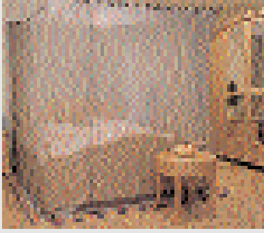
Abschirmbaldachin aus Aaronia-Shield® und Abschirmmatte aus Aaronia X-Dream®

Aaronia-Shield® bietet sich im Fensterbereich optimal als transparente Abschirmung an und dient zusätzlich noch als Fliegengitter. Auch der Einsatz als hochwertige Abschirm-Gardine oder Abschirm-Vorhang ist problemlos möglich. Aaronia bietet komplette, hochwertige Baldachinsysteme aus Aaronia-Shield® für Betten an. Um auch den Bodenbereich abzuschirmen, wurden hierzu passende Abschirmmatten aus Aaronia X-Dream® entwickelt. Über die Abschirmmatten werden die Baldachinsysteme dann auch geerdet und bieten so einen umfassenden Komplettschutz. Unsere Baldachinsysteme ermöglichen es selbst einem Laien, mit wenigen Handgriffen einen optimal abgeschirmten Schlafbereich zu errichten.